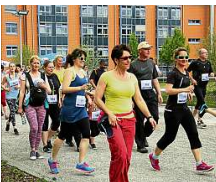
Autohaus Glinicke war auch in diesem Jahr Sponsor des 4. Hufeland-Laufes.

Neben den qualitativen Faktoren punktet das Unternehmen bei der Auszeichnung zum Audi Top Service Partner 2017 auch bei der Aus- und Weiterbildung der Mitarbeiter sowie durch ein Schauraum- und Werkstattkonzept auf dem neuesten Stand der Technik.