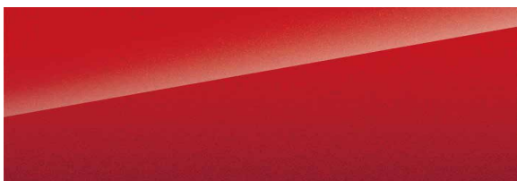
Emperor Red (Sonderausstattung)