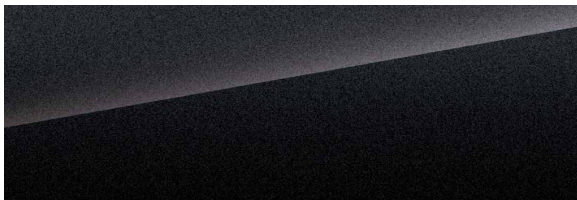
Silver sand black