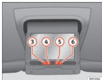
Fig. 4 Pantalla del Rear Seat Entertainment

Asegúrese de tener la fuente de vídeo conectada y encendida (conector AUX RSE) ⇒ página 4 antes de encender la pantalla. De no recibir ninguna señal, la pantalla se apagará pasados cinco minutos.