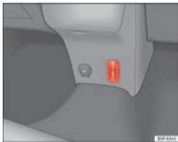
Fig. 1 AUX RSE connector