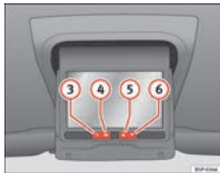
Fig. 2 Pantalla TFT del Rear Seat Entertainment ▶