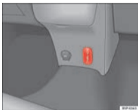
Fig. 3 AUX RSE connector

This connector may be used only as an audio input (red and white connectors) or audio and video connector (red, white and yellow connectors). Depending on the use, a cable adaptor with 2 or 3 RCA connections will be necessary. It is essential to use the correct RCA cable for the device (the RCA cable is usually provided with the portable device).